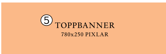
⑤ TOPPBANNER 780x250 PIXLAR